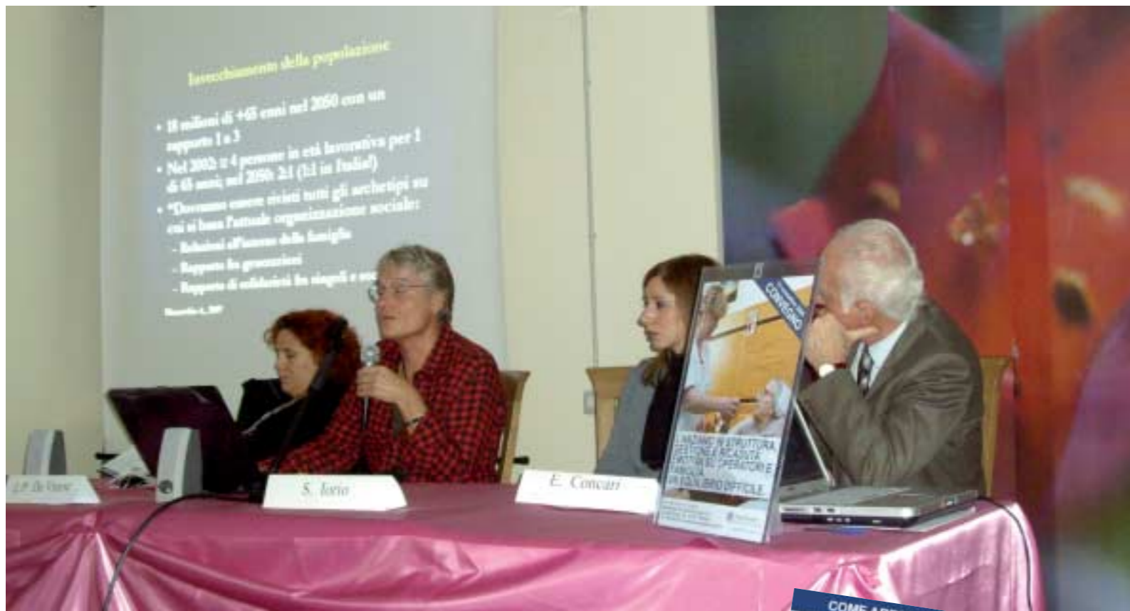
Momenti del convegno

Sono quattro i professionisti del campo sociosanitario che si sono resi disponibili a trasmettere il lin-