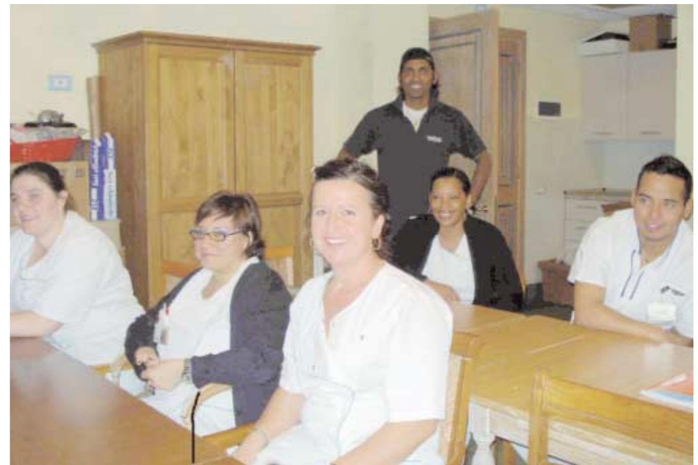
Ciao a tutti dai nuovi italiani

Le principali difficoltà che sono emerse in itinere sono riconducibili al lavoro per turni degli iscritti, che non ha purtroppo per-