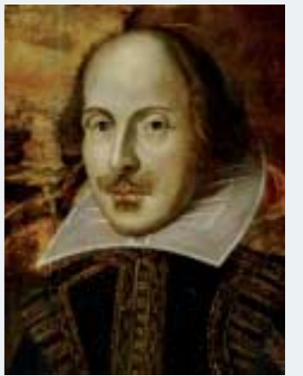
"William Shakespeare, Sonetto 116"

Se questo è un errore e verrà provato io non avrò mai scritto e nessun uomo mai amato ..."