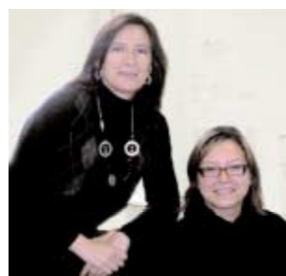
Chi è Cat Woman e chi Lara Croft?

E' per questo che vado in palestra! Perché non organizzare una gita nelle residenze oppure viaggi premio (ai dipendenti) nelle beauty