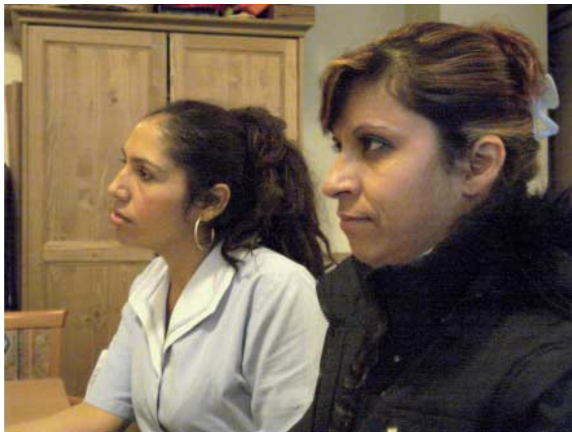
La concentrazione è intensa

messo ad alcuni la continuità formativa. Questo particolare aspetto condiziona molto la programmazione delle lezioni.