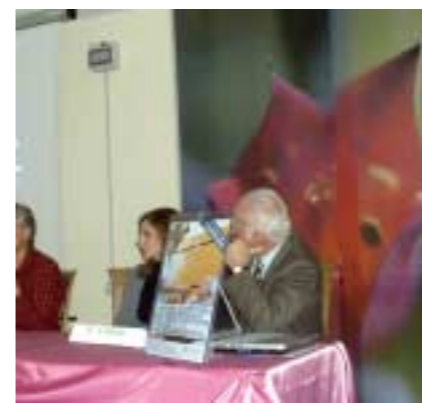
Un momento del convegno

Lo staff professionale di Residenze Anni Azzurri Ducale 2 e 3 ha maturato negli anni una grande esperienza nella cura e assistenza degli anziani. Nello stesso tempo nutriamo grande stima del lavoro svolto da tanti nostri colleghi nelle