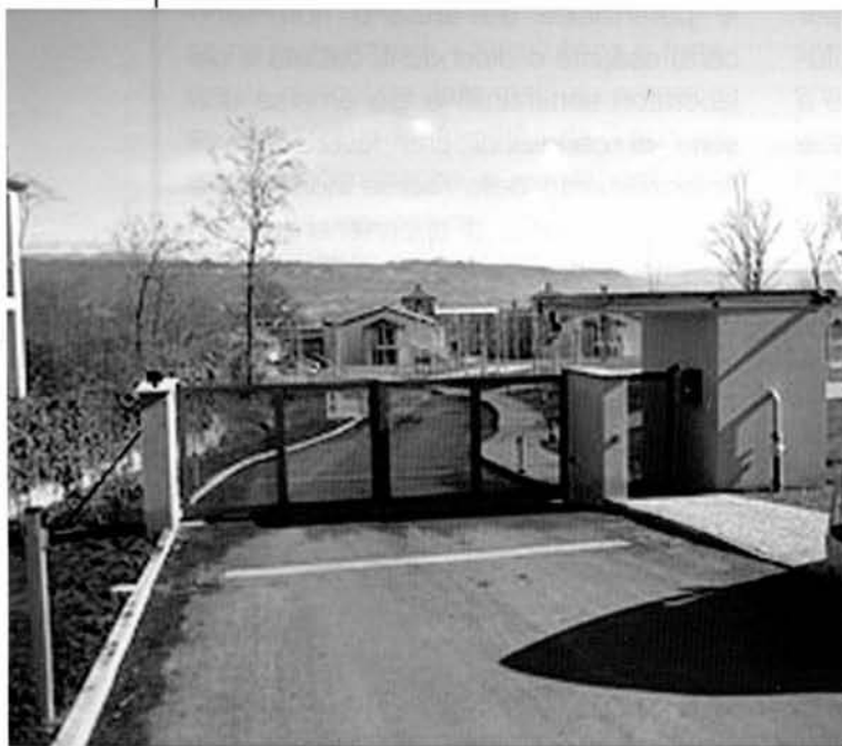
Residenza Palladio (NO)

La parola emersa da trattare nel Laboratorio successivo è stata Fiducia .